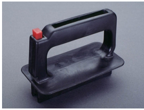
03 502 NH-Aufsteckgriff ohne Stulpe Größe 000 - 3