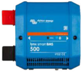
Lynx Smart BMS 500 A