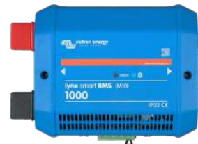
Lynx Smart BMS 1000A