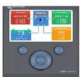
Panou de control Color GX